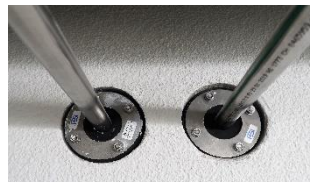
Kontrolle der Leitungsdurchführungen